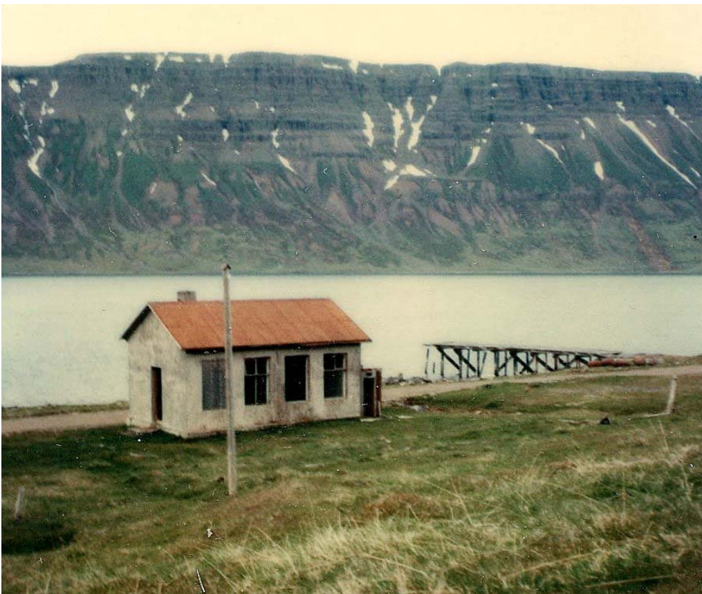
Skólinn opinn gluggarnir brotnir.