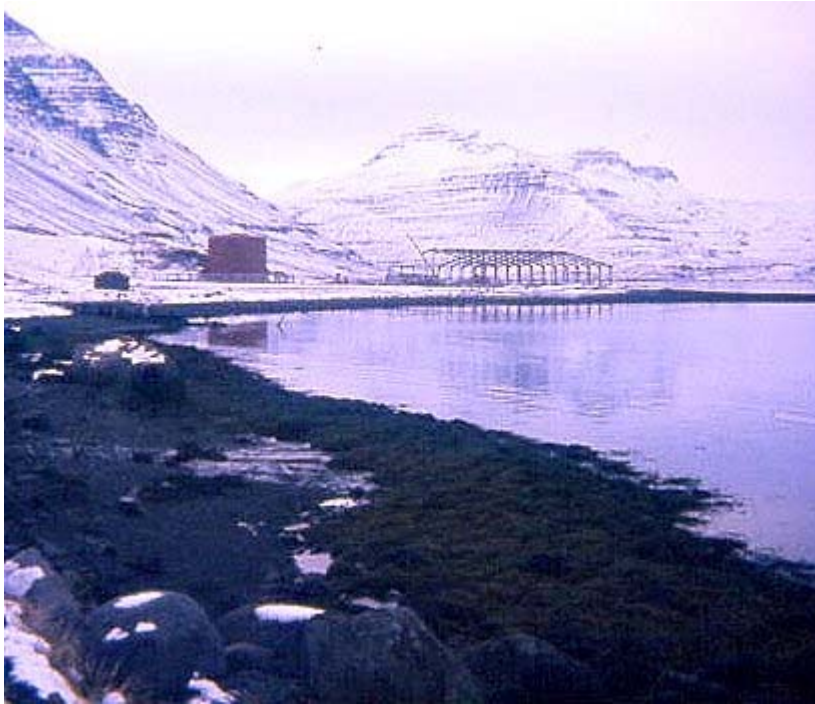
Fiskimjòlsverksmiðjan á Ölfueyri, Fjarðarsíld í byggingu.