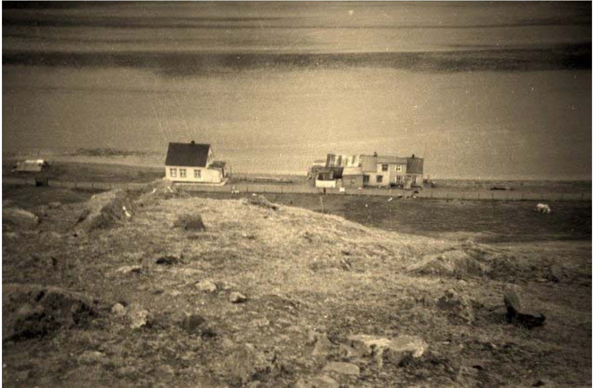
Stefánshús og Sjávarborg.