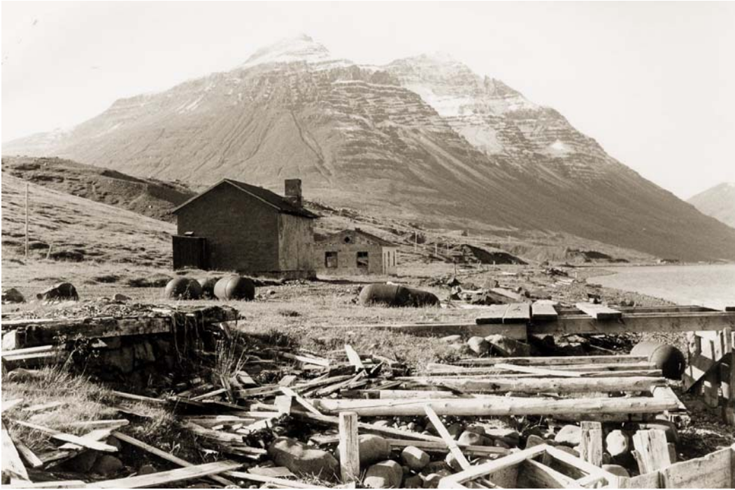
Húsin sem eftir stóðu, Skólinn og Hermes létu smám saman mikið á sjá.