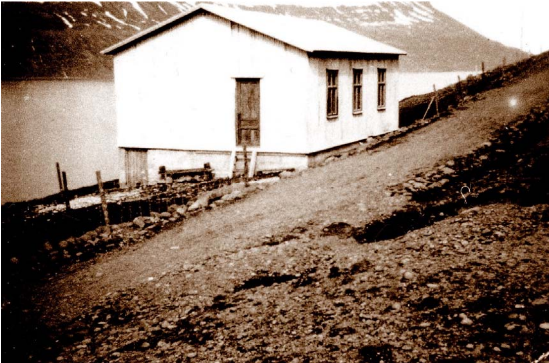
Skjaldbreið sem var samkomuhúsið í þorpinu.