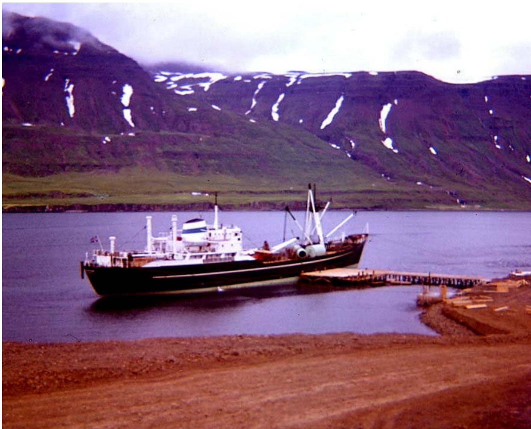
Skip við bryggju á Fjarðarsíld