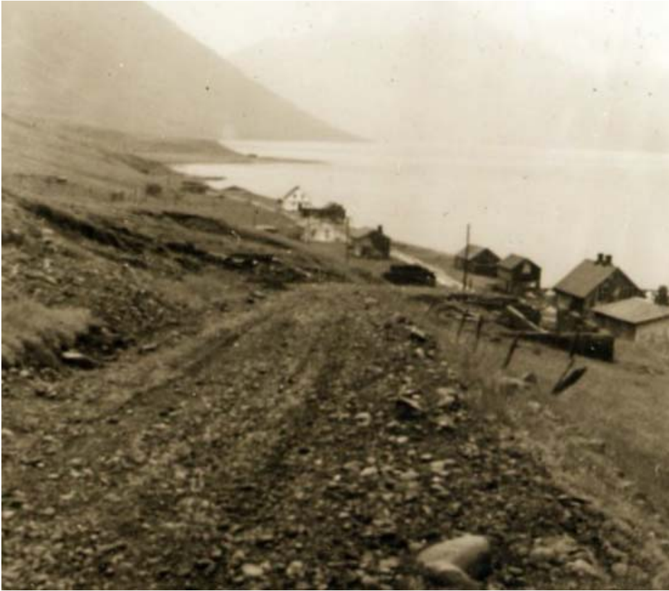
Eyrarþorpið horft inn eftir frá veginum í brekkunni í átt að Þórarinsstöðum og Haga.