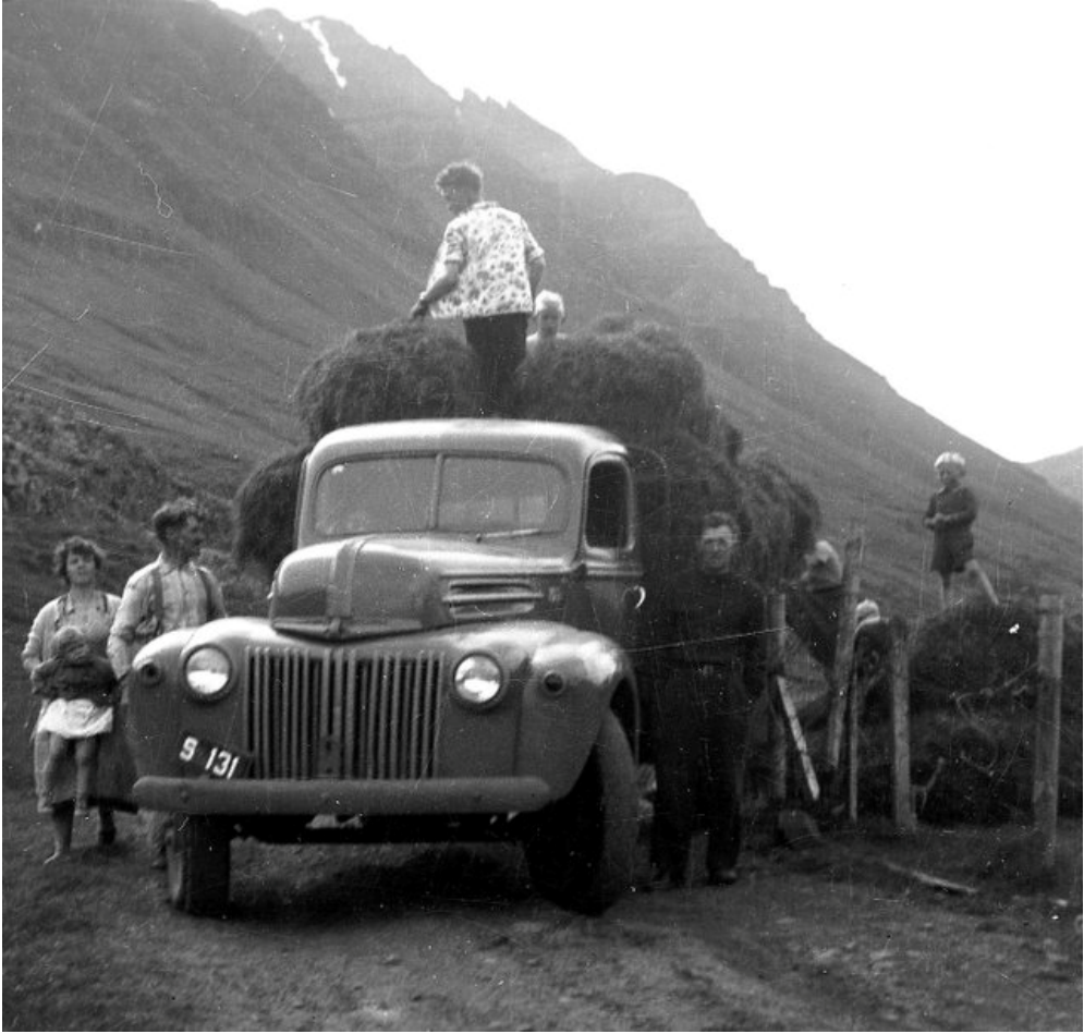
Heyskapur á Eyrnum