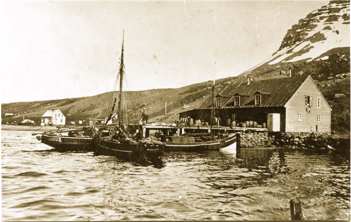
Evanger þar sem var heilmikil starfsemi tengd sjónum m.a. lifrabræðsla.