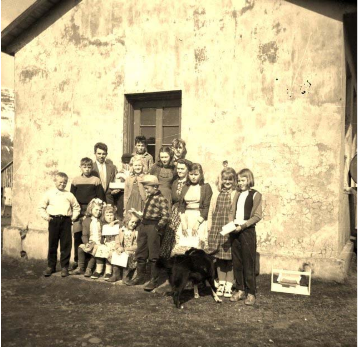
Krakkarnir í skólanum.

Hér eru nokkrar gamlar myndir af skólanum og Eyrarþorpi sem sýna húsin sem þar voru, þorpið og mannlífið á mismunandi tímum.