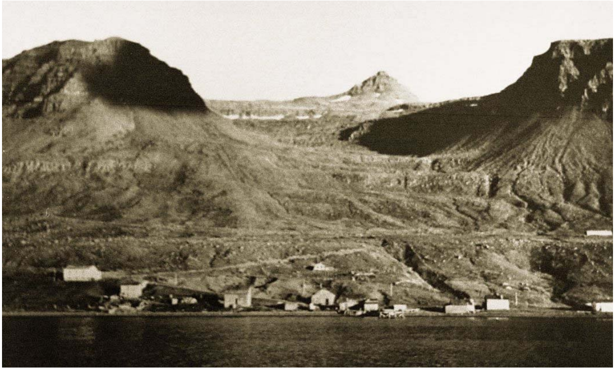
Eyrarþorpið séð frá sjó.