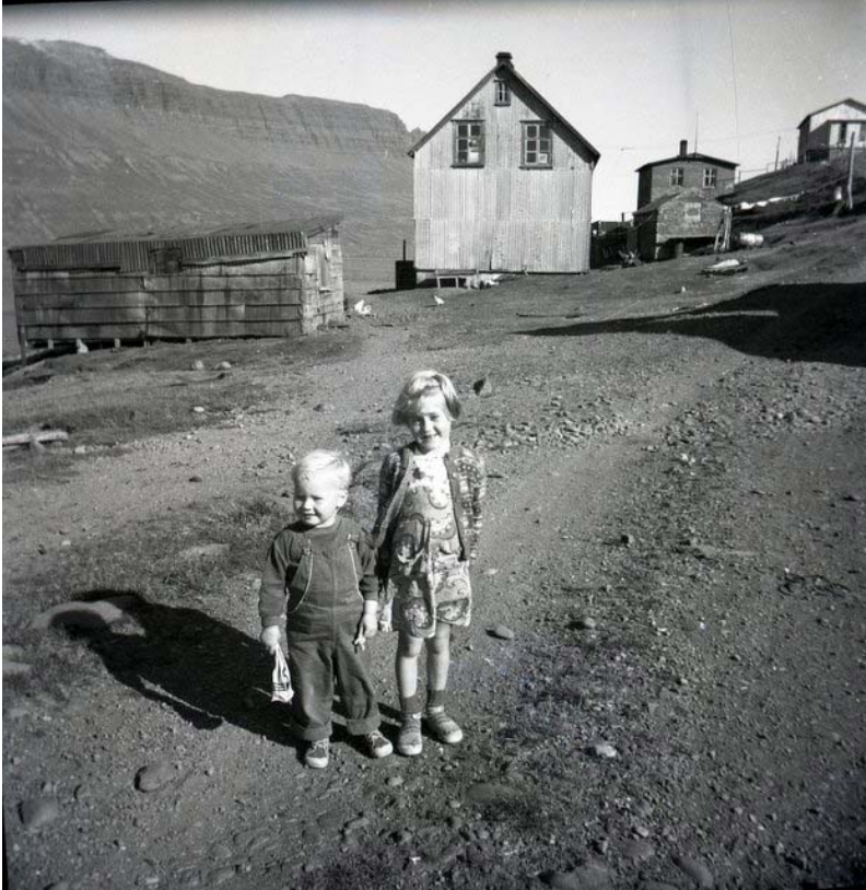
Húsið í miðri mynd er Dagsbrún.