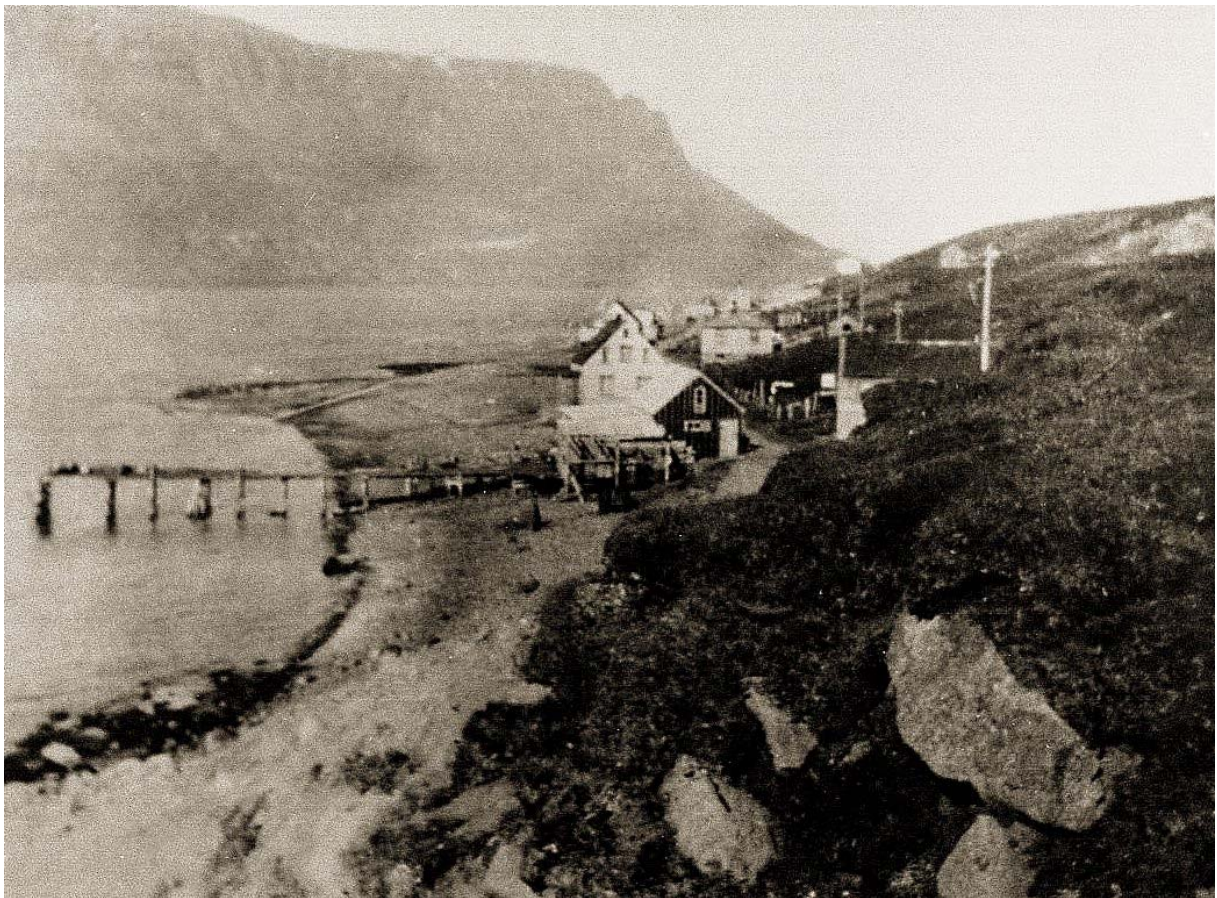
Eyrarþorpið, horft út fjörðinn.