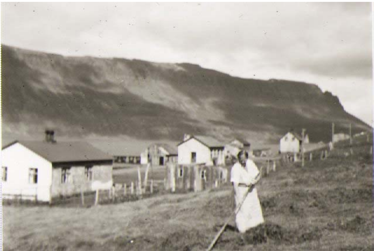
Heyskapur fyrir ofan Hermes.