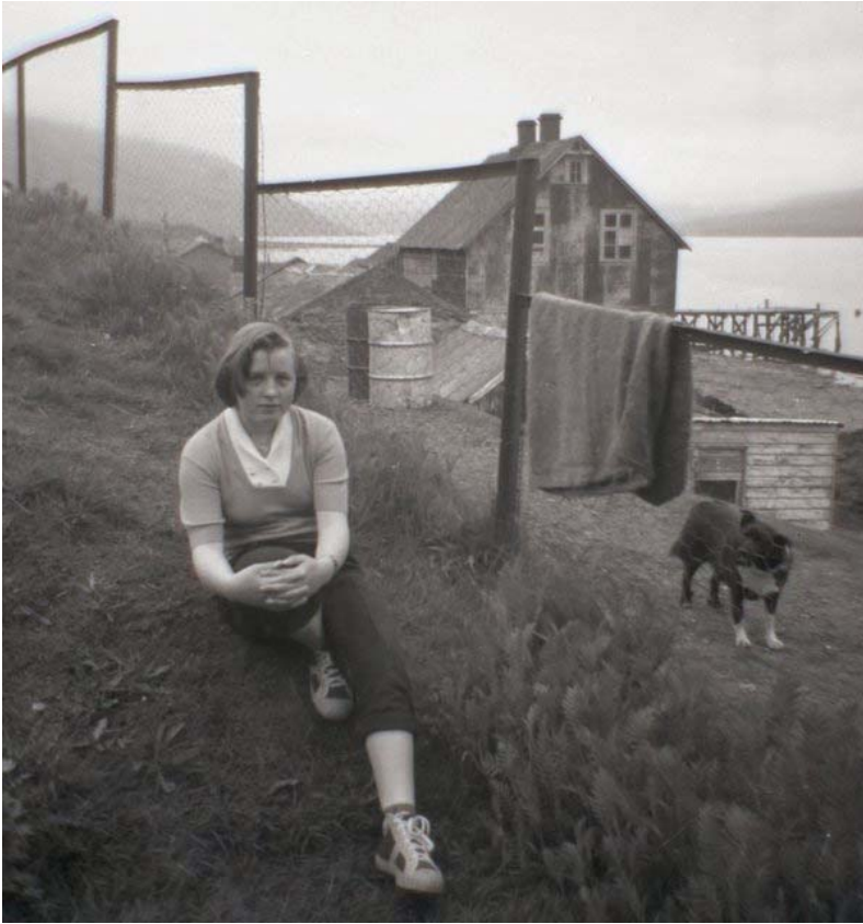
Utan við Dagsbrún.