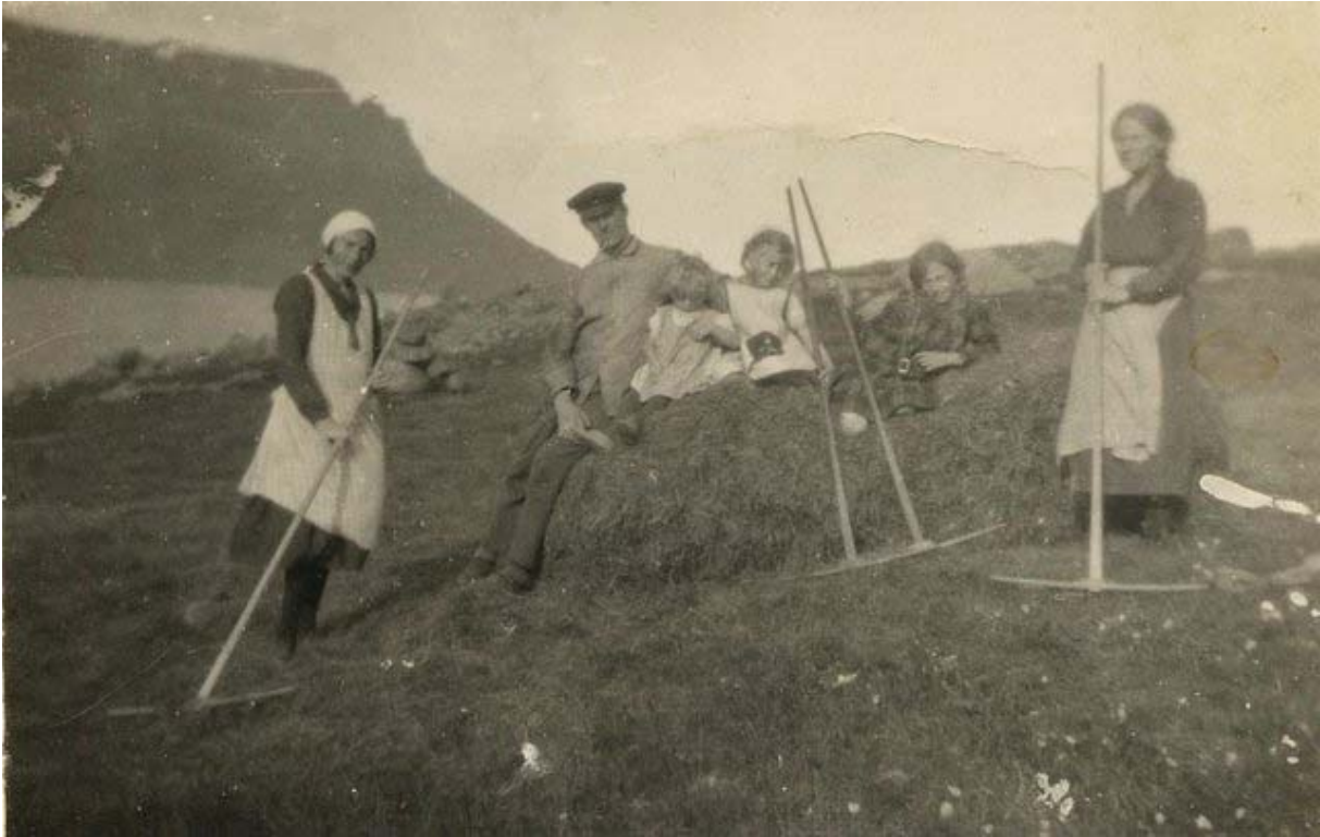
Heyskapur í Breiðumýri.